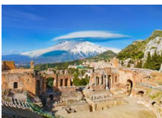
Milazzo 85km - 1h 7m Taormine