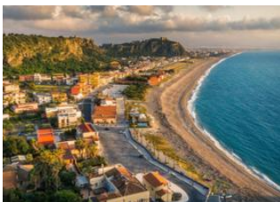
Aéroport V. Bellini - Catania Fontanarossa 📍 🚗 143km - ⌚ 1h 40m Milazzo 📍