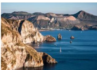
Milazzo 📍 🚗 - ⌚ 55m Lipari 📍